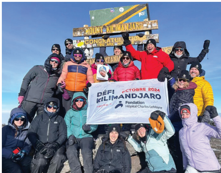
Un moment incroyable immortalisé au sommet du Kilimandjaro avec le drapeau de la Fondation.

Ces 20 aventuriers recrutés en un temps record de 2 semaines ont vécu l'expérience d'une vie. Ils nous prouvent que tout est possible lorsqu'on se mobilise pour une cause aussi importante!